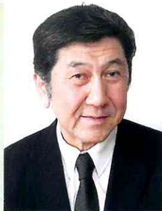
元厚生労働省老健局長 日本製薬団体連合会理事長